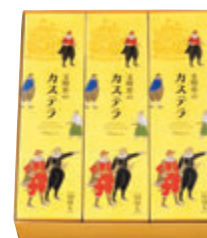
3A号(1A号3本) 税込4,569円 (本体価格4,230円) 301×256×67mm 番号 003