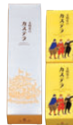
0.5A号2本入 税込1,512円 (本体価格1,400円) 292×82×67mm 番号 005