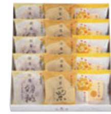
15個入 税込2,430円 (本体価格2,250円) (カステラ巻ハニー・ 栗饅頭・くるみ饅頭 各5個) 280×246×53mm 番号 121