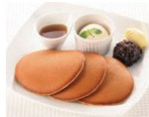
焼きたて“三笠”パンケーキ