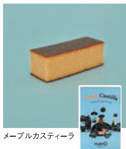
メーブルカスティーラ