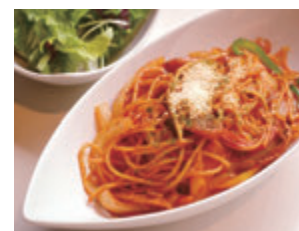
ナポリタンスパゲティ