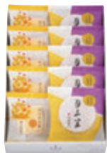
10個入 税込1,782円 (本体価格1,650円) (月三笠・カステラ巻ハニー 各5個) 293×192×68mm 番号 153