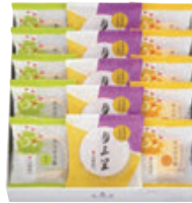
15個入(HM) 税込2,582円 (本体価格2,390円) (月三笠・カステラ巻(ハニー・抹茶) 各5個) 293×265×68mm 番号 155

[特定原材料等]文明堂のカステラ／小麦・卵 三笠山／小麦・卵・大豆 カステラ巻(ハニー・抹茶)／小麦・卵・乳・大豆 月三笠／小麦・卵・乳・大豆