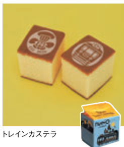
トレインカステラ