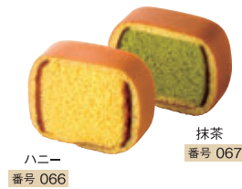
ハニー 番号 066

カステラをソフトなどら焼生地で包みました。 二つの層から生まれる豊かな美味しさをお楽しみいただけます。