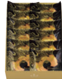
12個入 税込 3,672円 (本体価格3,400円) 292×206×70mm 番号 178