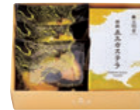
GB0.5号 税込 2,538円(本体価格2,350円) 153×208×70mm 番号 179 (特撰五三カステラ0.5B号 1本・バームクーヘン 3個)