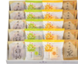
20個入(HM) 税込3,240円 (本体価格3,000円) (カステラ巻(ハニー・抹茶)・ 栗饅頭・くるみ饅頭 各5個) 290×310×53mm 番号 123

[特定原材料等]カステラ巻(ハニー・抹茶)／小麦・卵・乳・大豆 栗饅頭／小麦・卵・大豆 くるみ饅頭／小麦・卵・くるみ・大豆