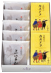
CM3号 税込2,754円 (本体価格2,550円) (文明堂のカステラ0.5A号 2本・三笠山 5個) 304×202×67mm 番号 115