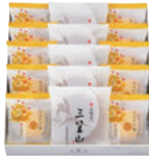
A15個入 税込2,852円 (本体価格2,640円) (三笠山 5個・カステラ巻ハニー 10個) 293×265×68mm 番号 118