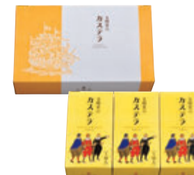
0.5A号3本入 税込2,268円 (本体価格2,100円) 149×248×67mm 番号 006