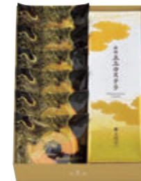
GB1号 税込 5,076円(本体価格4,700円) 292×206×70mm 番号 180 (特撰五三カステラ1B号 1本・バームクーヘン 6個)

[特定原材料等] 特撰五三カステラ / 小麦・卵 バームクーヘン / 小麦・卵・乳・りんご・アーモンド バームクーヘンは洋酒を使用しています。