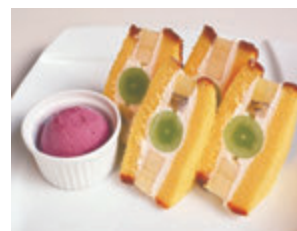
かすてらフルーツサンド