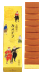
1A号 税込1,458円 (本体価格1,350円) 286×80×62mm 番号 001 ※1本10切入

原材料は「卵、小麦粉、砂糖、水あめ」の4つ。 安心・安全な素材でおつくりしたシンプルなカステラです。 底に敷いたザラメ糖は、日を追うごとにじんわり溶けてカステラをしっとりさせます。