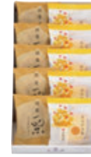
10個入 税込1,642円 (本体価格1,520円) (カステラ巻ハニー・ 栗饅頭 各5個) 290×161×53mm 番号 120