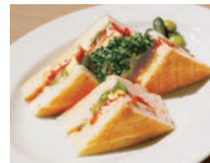
スモークチキンのホットサンド