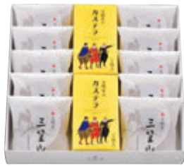
CM4号 税込3,996円 (本体価格3,700円) (文明堂のカステラ0.5A号 2本・三笠山 10個) 299×325×69mm 番号 116