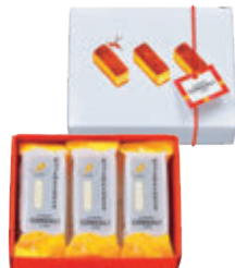
ギュットとひとくちティラ はちみつ