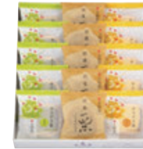
15個入(HM) 税込2,430円 (本体価格2,250円) (カステラ巻(ハニー・抹茶)・ 栗饅頭 各5個) 280×246×53mm 番号 122