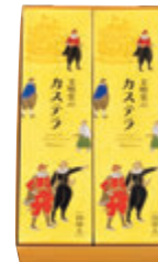
2A号(1A号2本) 税込3,078円 (本体価格2,850円) 301×174×67mm 番号 002