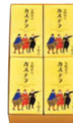
0.5A号4本入 税込3,078円 (本体価格2,850円) 301×174×67mm 番号 007