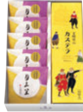
CT1号 税込2,484円 (本体価格2,300円) (文明堂のカステラ1A号 1本・月三笠 5個) 304×202×67mm 番号 156