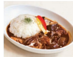
文明堂ハヤシライス