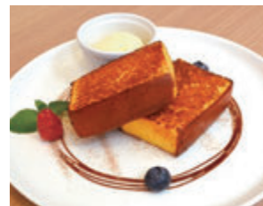
フレンチカステラ