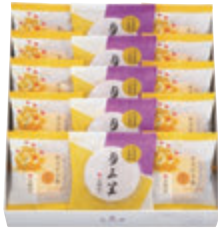
15個入 税込2,582円 (本体価格2,390円) (月三笠 5個・カステラ巻ハニー 10個) 293×265×68mm 番号 154