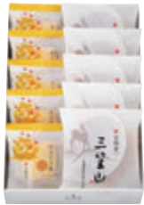
A10個入 税込2,052円 (本体価格1,900円) (三笠山・カステラ巻ハニー 各5個) 293×192×68mm 番号 117