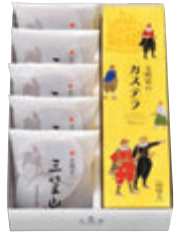
CM1号 税込2,754円 (本体価格2,550円) (文明堂のカステラ1A号 1本・三笠山 5個) 304×202×67mm 番号 114